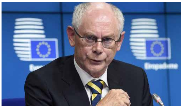
El presidente del Consejo Europeo, Herman Van Rompuy, da una rueda de prensa tras una cumbre europea en Bruselas, el 31 de agosto de 2014