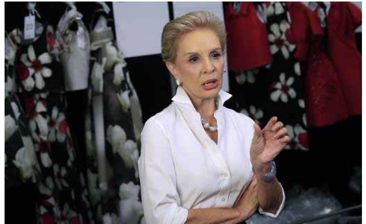
La diseñadora Carolina Herrera entre bastidores antes de la presentación de su colección primavera-verano 2015 en la semana de la moda de Nueva York, el 8 de setiembre de 2014.

"Es un material que se usa normalmente para bucear (como el neopreno), pero se puede mezclar de manera moderna y es fascinante trabajar con él, porque se amolda de tal manera al cuerpo que le da a la mujer una silueta muy seductora y femenina".