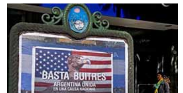
Una persona pasa el 18 de junio de 2014 en Buenos Aires ante un cartel de repudio a los tenedores de bonos argentinos que reclaman cobrarlos

El Gobierno sostiene que el fallo de Griesa implica dividendos mayores al 1.600% para los fondos litigantes, que compraron la deuda ya en default, y les propone a cambio