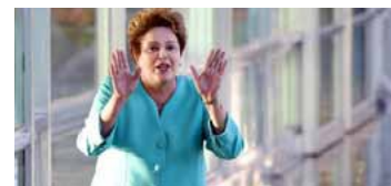
La presidenta, Dilma Rousseff, brinda una conferencia de prensa en Brasilia el 8 de setiembre de 2014

Las acusaciones cayeron como un balde de agua fría en el gobierno y complicaron más el panorama electoral de Rousseff a pocas semanas de las presidenciales, el 5 de octubre,