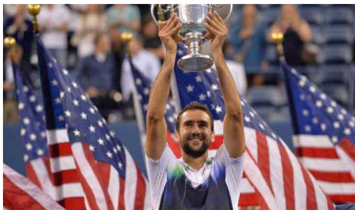
El croata Marin Cilic sujeta la copa de campeón del US Open 2014, en Nueva York, tras derrotar en la final al japonés Kei Nishikori, el 8 de septiembre de 2014

NUEVA YORK (AFP) - El croata Marin Cilic derrotó este lunes al japonés Kei Nishikori en tres sets corridos de 6-3, 6-3, 6-3, para adjudicarse el Abierto de Estados Unidos de tenis que se jugó en Nueva