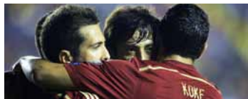
El mediocampista español David Silva (C) es felicitado por sus compañeros, Jordi Alba (I) y Koke (D), en la victoria 5-1 ante Macedonia, en partido de fase de clasificación para la Eurocopa de Francia-2016, el 8 de septiembre de 2014 en Valencia

Valencia (España) (AFP) - España inició con buen pie la defensa de su título continental al golear 5-1 a Macedonia, este lunes en partido de clasificación para la Eurocopa de 2016 en Francia. Sergio Ramos abrió el marcador de penal (16) antes de que el “novato” Paco Alcácer