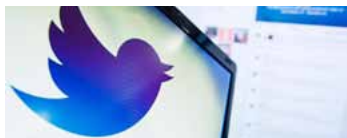
El logó de Twitter

"Es un primer paso hacia la funcionalidad de Twitter a la hora de hacer compras convenientes y fáciles, y con suerte incluso divertidas, desde aparatos móviles", comentó