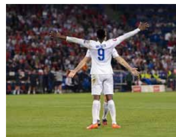
El delantero inglés Danny Welbeck celebra uno de sus dos goles ante Suiza (2-0), en el partido de clasificación para la Eurocopa de Francia-2016, el 8 de septiembre de 2014 en Basilea

El acierto de Welbeck estuvo acompañado por el buen hacer de Rooney, nuevo capitán del combinado británico. Exiliado en la banda,