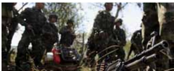
Soldados colombianos durante una operación contra las FARC el 21 de julio de 2012.

La delegación no tardó en contestarle. "No existe ninguna persona (...) con ese nombre", dijo en una misiva citada este domingo por la revista