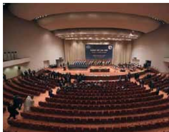
El Parlamento iraquí se reúne el 8 de septiembre de 2014 en Bagdad para votar el gobierno de unidad.

Kerry dijo que la coalición contra el EI está destinada a durar “meses e