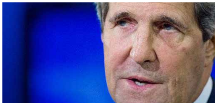
El secretario de Estado estadounidense, John Kerry, dialoga con la prensa en el Departamento de Estado, en Washington, el 8 de setiembre de 2014

Algunos países aportarán “asistencia militar, directa o entrenando, armando, equipando y asesorando”. Otros contribuirían con ayuda humanitaria para civiles atrapados en los puntos de mira del EI, ayudando a obstruir su financiación, deteniendo el flujo de combatientes extranjeros a los campos de batalla en Irak y Siria y contraatacando la propaganda del EI. Entre los países