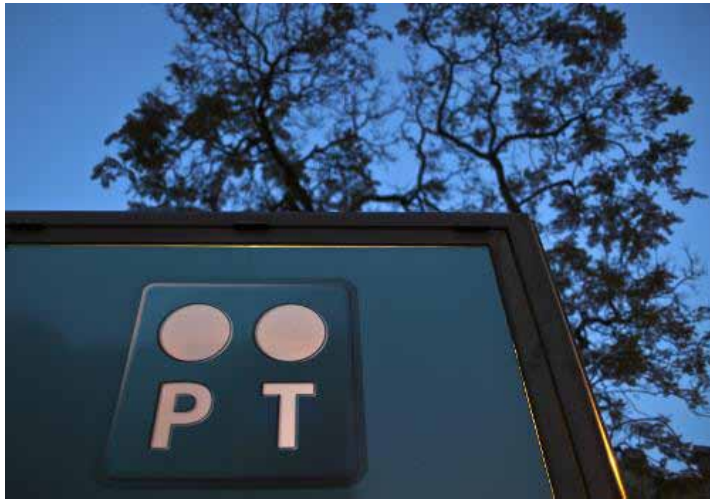
Logó de Portugal Telecom fotografiado en Lisboa el 2 de julio de 2010